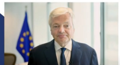
Didier Reynders Commissaire européen à la Justice