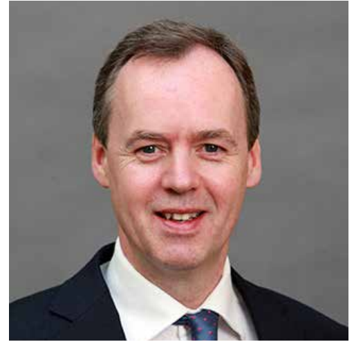
David Conlan Smyth, Presidente del Comitato per la migrazione del CCBE

Il 10 novembre 2020, David Conlan Smyth, ha partecipato al seminario online dal titolo «EU politiche migratorie: inumanità nel diritto e nella pratica», organizzato dal Forum europeo delle forze di sinistra, verdi e progressiste del Parlamento europeo per discutere del Nuovo Patto sulle migrazioni e l'asilo. Il video dell'incontro è disponibile qui .