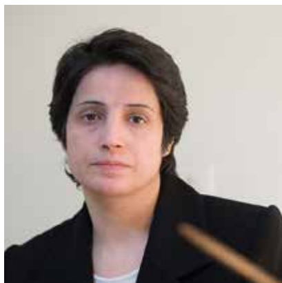
Nasrin Sotoudeh, Detained Iranian lawyer