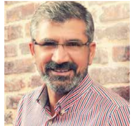
Tahir Elçi, Murdered Turkish lawyer

► Giugno 2020: Missione d'inchiesta sulle prove di CHD