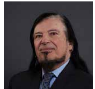
Iain G. Mitchell QC, presidente del gruppo di lavoro sulla sorveglianza del CCBE

ELD viene celebrata lo stesso giorno della Giornata europea della giustizia, che ha lo scopo di informare i cittadini sui loro diritti e di rafforzare la fiducia nei sistemi giudiziari nonché di aiutare i cittadini a familiarizzare con le nuove tecnologie a disposizione della professione legale.