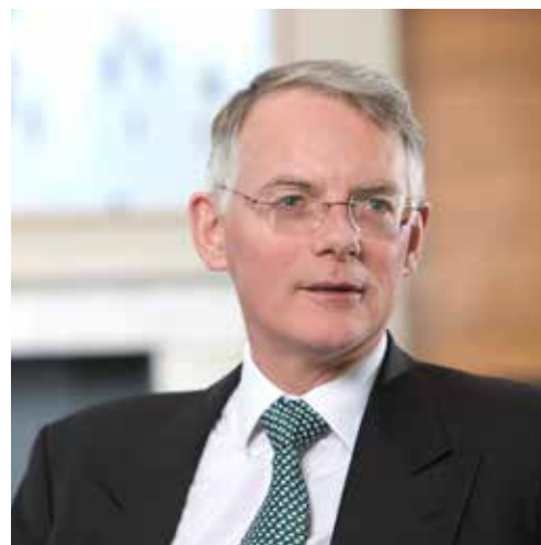
Piers Gardner, presidente della delegazione permanente del CCBE presso la Corte europea dei diritti dell'uomo

Inoltre, il CCBE ha recentemente pubblicato una versione aggiornata della sua Guida pratica «La Corte europea dei diritti dell'uomo»: Domande e risposte per gli avvocati» che viene introdotta da una prefazione dell'attuale presidente della Corte europea dei diritti dell'uomo Robert Spano. Questa guida è rivolta agli avvocati che intendono adire la Corte europea dei diritti dell'uomo. Questa guida pratica aggiornata offre solo informazioni chiave. Non può sostituire il riferimento ai documenti principali pertinenti, in particolare quelli disponibili sul sito web della Corte , la giurisprudenza degli organi di Strasburgo e la bibliografia generale sul diritto della Convenzione europea dei diritti dell'uomo.