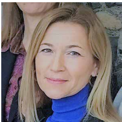
Noemí Alarcón Velasco, Vicepresidente del Comitato per la migrazione del CCBE

I 6 ottobre 2020, il vicepresidente del Comitato sulle migrazioni del CCBE, Noemí Alarcón Velasco, ha partecipato alla tavola rotonda virtuale dell'ONU «Il futuro dell'Europa: i diritti umani internazionali nel diritto e nella politica dell'UE», dove ha condiviso la sua esperienza come avvocato sull'uso della Carta dell'UE insieme agli strumenti internazionali. Lo scopo dell'incontro è stato quello di discutere un nuovo studio commissionato dall'Ufficio regionale per i diritti umani dell'ONU per l'Europa che esamina in che misura il diritto, le politiche e i programmi dell'UE sono ancorati alle norme e agli standard dell'ONU in materia di diritti umani. Lo studio esamina i vantaggi di una maggiore integrazione del diritto internazionale dei diritti umani nel diritto e nelle politiche dell'UE, individua le opportunità per un migliore allineamento e le possibili vie da seguire.